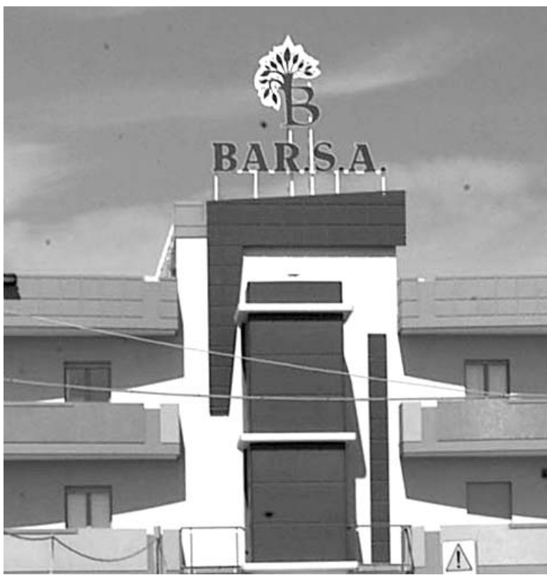
Sotto, la sede della Barletta servizi ambientali a Callano

Continua, serrato, il dibattito dopo la contestazione in piazza Aldo Moro al governatore