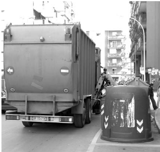
Un automezzo della Barsa