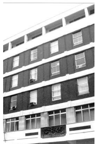
Palazzo di Città

Il progetto prevede la costituzione di due società: Barsa Energy e Barsa Gestioni